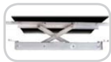
提升未成槽传送带