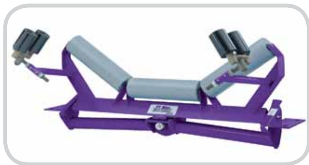
PT Max 顶部传送物料面

与大多数只能旋转的传统调整器不同，PT Max 调整器还可以倾斜轴杆以快速将输送带复位。下面具体说明操作方式：传感器托辊可以让输送带在预定大小范围内移动（一般小于 25 毫米 (1")）。输送带一旦超过这个范围，两个传感器托辊会啮合输送带的边缘，使顶部框架开始旋转。旋转会立即触发相应的倾斜动作，从而增加输送带偏移一侧的张力并减小另一侧的张力。这种不平衡张力会使输送带移回中心位置。