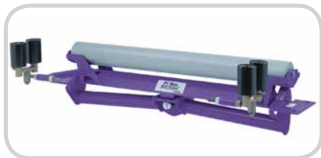
PT Max 回程面